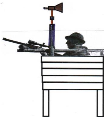
Abb 1: Sitz